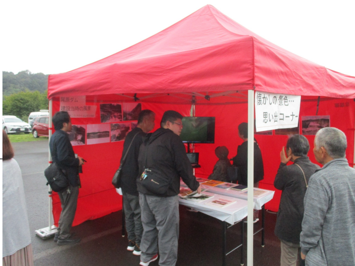
「ダム移転前」の家屋や様子を上映した「思い出コー ナー」にはたくさんの方が集まりました

テント村では地元の食 材を使った飲食ブースな どの店舗が出店され、大 賑わいとなりました。 また、今年度は「ダム になる前の風景を思い出 すコーナー」として、昔 の映像や写真などを展示 したブースを設けました。 ダムの底に沈んだ風景 を、じっくり懐かしむ方