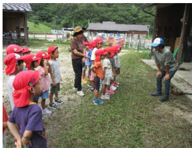
① さくらおろち牧場（馬とのふれあい体験）

さくらおろち湖周辺には、様々な魅力的なスポットがあります。その魅力を身近に感じてもらいたい！ということで保育園や子ども園を対象に園児の皆さんに遠足で訪れてもらおうという取り組みが『遠足ウィーク』です。参加して下さったのは出雲市、雲南市内の合計6園145名の園児の皆さんです。