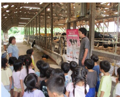
② ダムに見える牧場（牛とのふれあい体験）