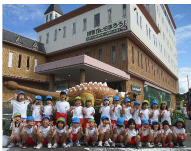
③ 奥出雲多根自然博物館