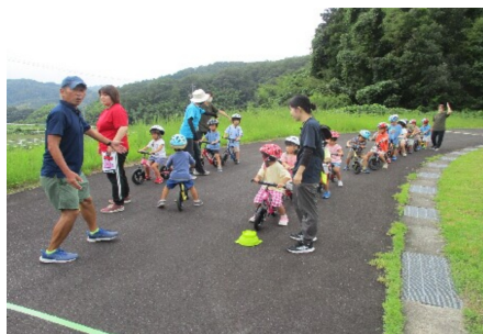
⑤ 自転車競技施設（ランニングバイク体験）